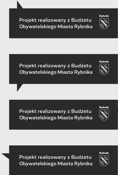
na jasne tło